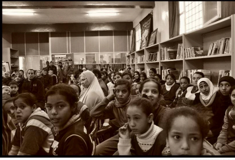
Süleyman Cultural Center Feb 24th

Daeş ideolojisinin ve mesajının yayılmasına yol açan şartlar, bir başka deyişle, aşırıçılığın “kökünde yatan sebepler” yapılan birçok araştırma ve girişimle anlaşılmaya çalışılıyor. Yine de toplulukların, sivil toplumun ve devlet aygıtının aşırıçılığın temelindeki bu sebeplerle nasıl mücadele ettiklerine dair daha fazla diyalog içinde olmaları gerekiyor. Köktencilikle mücadelede topluma dayalı yerel çözümlerin yanı sıra aşırıçılıkla mücadele eden sivil toplum girişimlerinin çabalarına karşılaştırmalı olarak incelemek, gelecekteki girişimler ve politikaların faydalanabileceği bir iyi uygulamalar listesinin çıkmasını sağlayacaktır. Bu